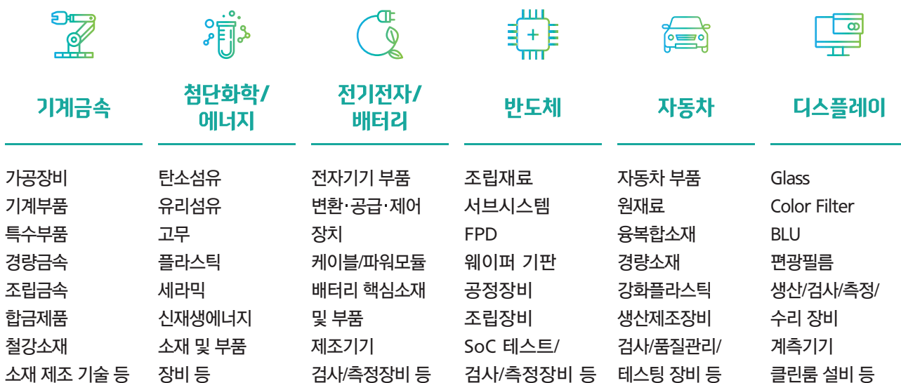
Exhibit Items 전시 품목